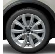
Grange Hill (O)