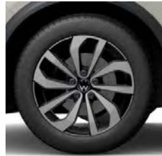
Johannesburg bi-color (O)