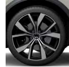
Misano bi-color (O)