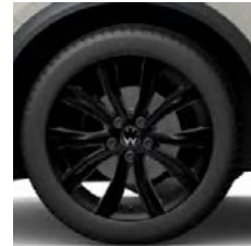
Grange Hill zwart (O)