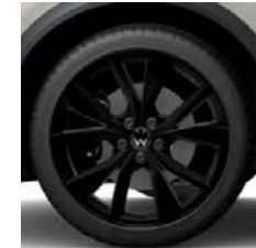
Misano zwart (O)

L = standaard op Life S = standaard op Style R = standaard op R-Line O = optioneel