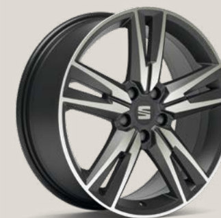
Performance Cosmo Grey