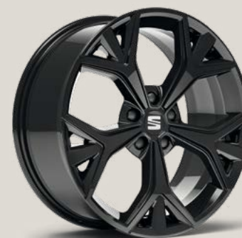
Exclusive Glossy Black