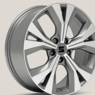
Performance Nuclear Grey