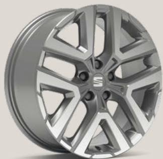
Performance II Nuclear Grey