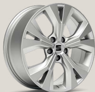
Performance Brilliant Silver type 1