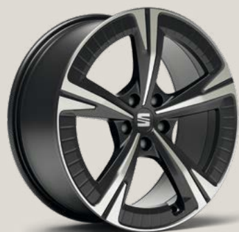
Aerowheels Cosmo Grey