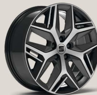
Exclusive Cosmo Grey Type 1