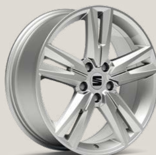
Performance Brilliant Silver type 2