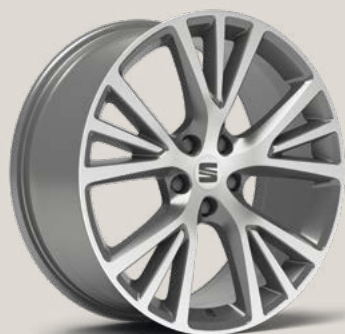
Exclusive Nuclear Grey