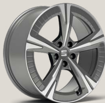
Aerowheels Nuclear Grey