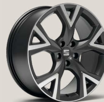
Exclusive Cosmo Grey Type 2