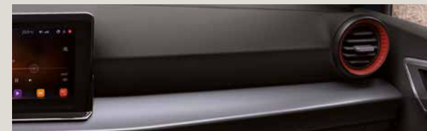
LE MANS STOF SPORT SEATS