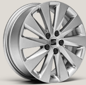
DESIGN BRILLIANT SILVER R St SBI