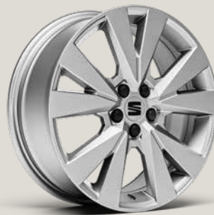
DYNAMIC BRILLIANT SILVER XP