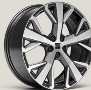
PERFORMANCE NUCLEAR GREY MACHINED XP