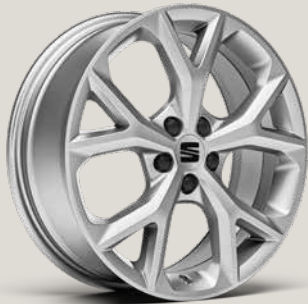
DYNAMIC SPORT BRILLIANT SILVER FR FBI