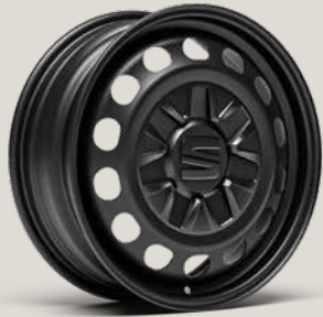
URBAN STALEN VELG R