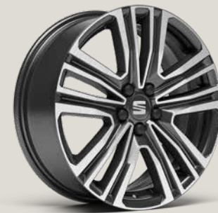
DYNAMIC NUCLEAR GREY MACHINED St SBI