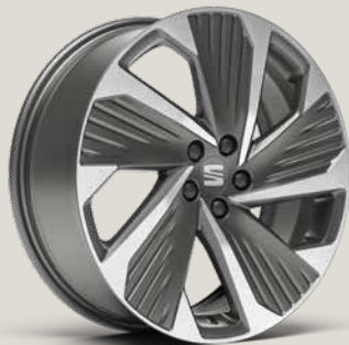
PERFORMANCE COSMO GREY MATTE MACHINED FR FBI