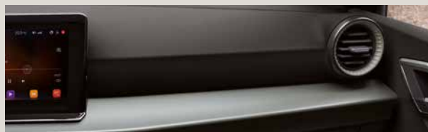
DINAMICA® BLACK SPORT SEATS