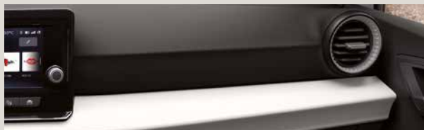
COMO STOF COMFORT SEATS