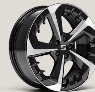
PERFORMANCE BLACK R MACHINED FR FBI FR+