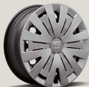
URBAN WIELDOPPEN R