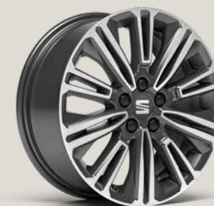
DESIGN NUCLEAR GREY MACHINED St SBI