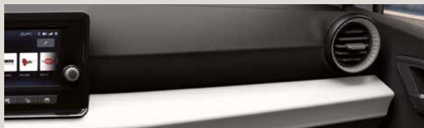
ACERO STOF COMFORT SEATS